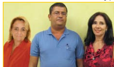
Membros da comissão eleitoral